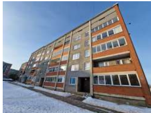
Dzīvojamā māja Dārzu ielā 67