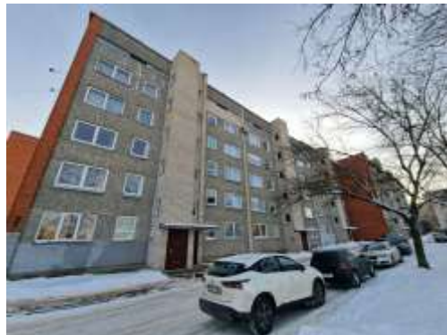
Dzīvojamā māja Dārzu ielā 67