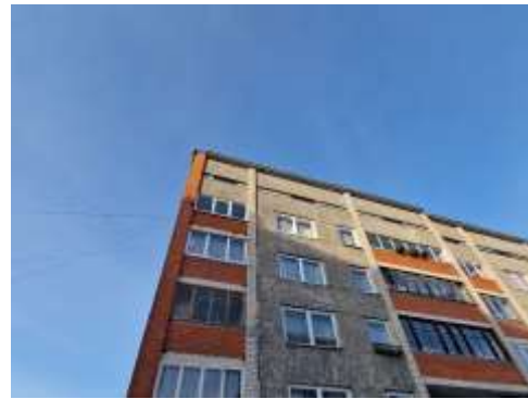
Dzīvokļa Nr.13 logi