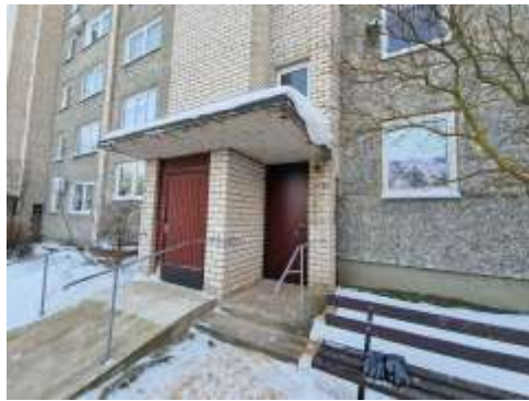
Ieeja kāpņu telpā